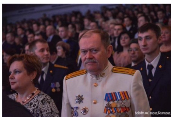
Городское торжественное мероприятие, посвященное Дню защитника Отечества

На площадке в парке Победы состоялся театрализованный праздничный концерт. Завершились праздничные мероприятия фейерверком.