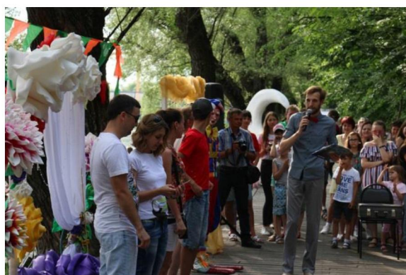
Цикл мероприятий «Театральный сезон»