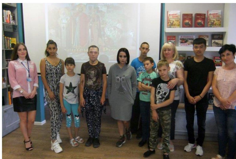
Исторический экскурс «Крещение Руси: легенды и факты»

В модельной библиотеке-филиале №18 воспитанники областного социально-реабилитационного центра для несовершеннолетних и детского сада № 52 узнали историю Крещения Руси. Ребята просмотрели видеоролики «Былина о том, как князь Владимир Русь крестил» и «Повесть временных лет: Крещение Руси». В завершение мероприятия дети ознакомились с книжно-иллюстративной выставкой «Живи и славься Русь святая». Всего было проведено 16 мероприятий, которые посетило 368 человек.