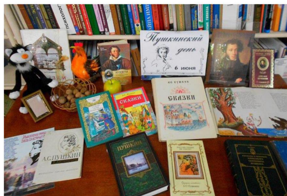
Цикл мероприятий к 220-летию со дня рождения А.С. Пушкина