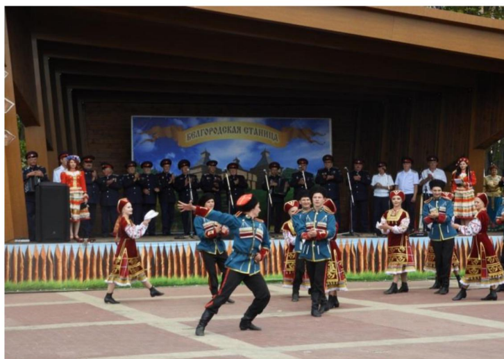
Фестиваль казачьей культуры «Белгородская станица»

В парке Победы состоялся VI фестиваль казачьей культуры «Белгородская станица». В программе: выставка-ярмарка, выступления казачьих ансамблей и клубов военно-исторической реконструкции, парад участников и гала-концерт фестиваля, показательное выступление мастеров фланкировки.