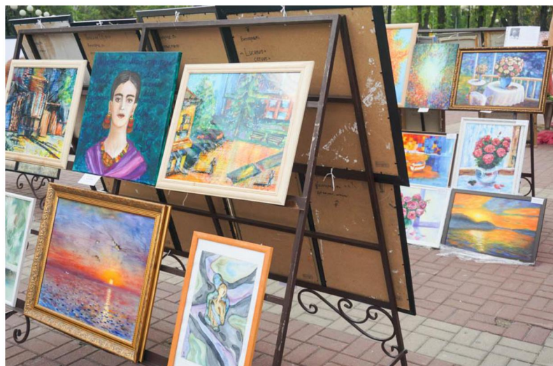
Выставка художественных работ совместно с БРО ВТОО «Союз художников России»

инсталляции от объединения молодых художников «Сковил»; организация тематических фотозон.