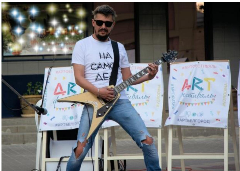
Арт-фестиваль «Изобразительное искусство и дизайн»

Так, 2 августа на Свято-Троицком бульваре, театральном проезде, в парке «Победы», состоялся АРТ-фестиваль (фестиваль дизайна и изобразительных искусств), который представил мастер-классы по акварели, декоративно-прикладному творчеству, скейтчингу, каллиграфии, рисованию комиксов.