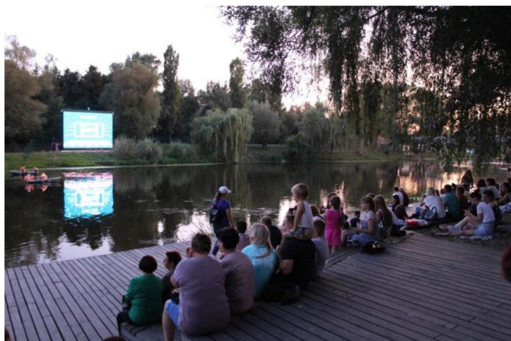
Кинопоказ в парке Победы на набережной реки Везелка

Всего же на набережной реки Везелка было организовано около 50 просмотров фильмов, которые посетили около 100 000 чел.