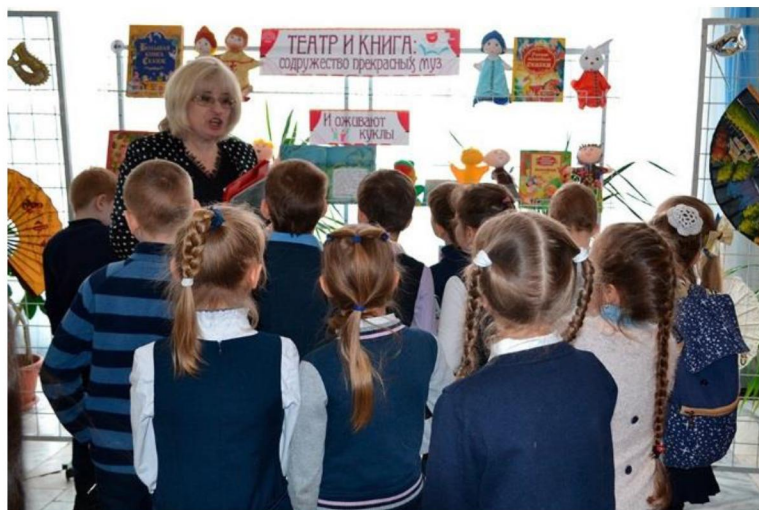
Открытие Недели детской книги