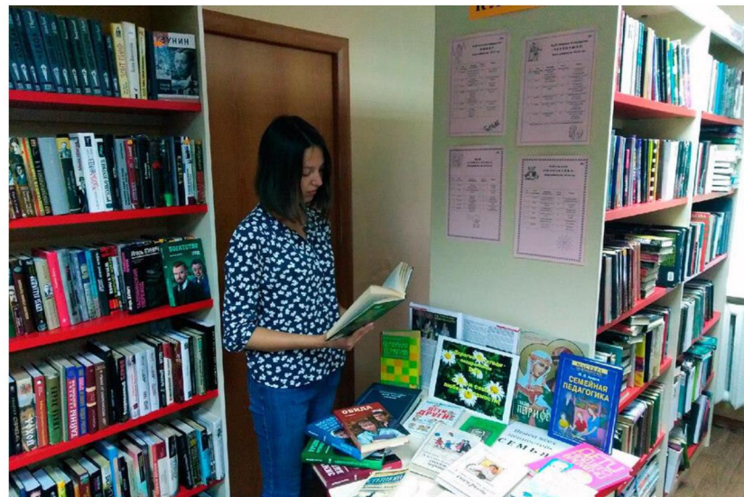
Книжно-иллюстративные выставки «Любовь и верность на века»

В библиотеках-филиалах были оформлены книжно-иллюстративные выставки «Любовь и верность на века». Всего состоялось 29 мероприятий, которые посетило 754 человека.