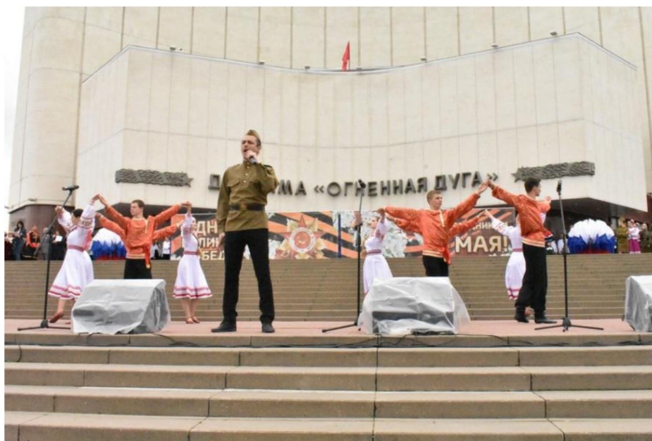
Акция-концерт «Победная весна», посвященная 74-й годовщине Великой Победы нашего народа в Великой Отечественной войне

В течение дня на площади музея-диорамы, сцене парка Победы, набережной реки Везелки была организована праздничная программа «Наша Победа!» – массовые гуляния, солдатская каша, праздничный концерт с участием творческих коллективов города, художественные выставки. Завершились мероприятия праздничным фейерверком.