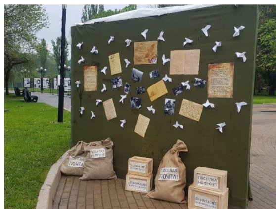
Экспозиция «Фотографы Великой Отечественной»