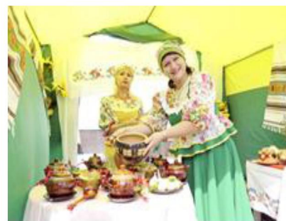
Фестиваль «Русская каша»

В преддверии Старого Нового года на Соборной площади состоялся Фестиваль вареников. Лучшие творческие коллективы города подготовили развлекательную программу. Гости ознакомились с традициями праздника, приняли участие в конкурсе на лучший вареник и битве колядок.