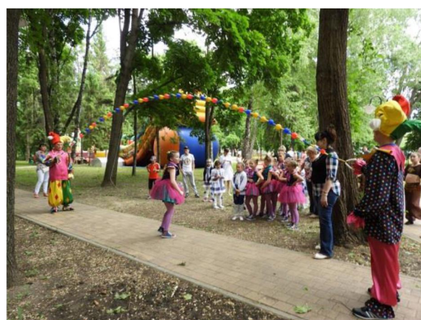
Работа детского парка «Котофей»