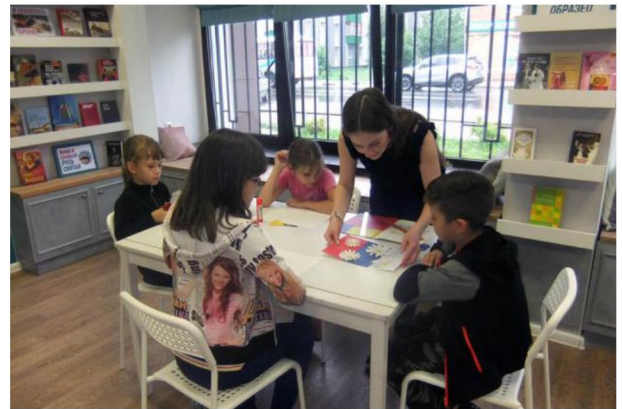
Мастер-классы в муниципальных библиотеках города

В библиотеках-филиалах были оформлены книжно-иллюстративные выставки «Любовь и верность на века». Всего состоялось 29 мероприятий, которые посетило 754 человека.