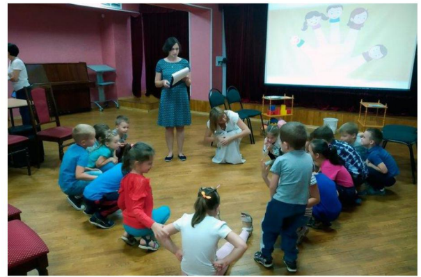
Празднично-игровые программы в муниципальных библиотеках города