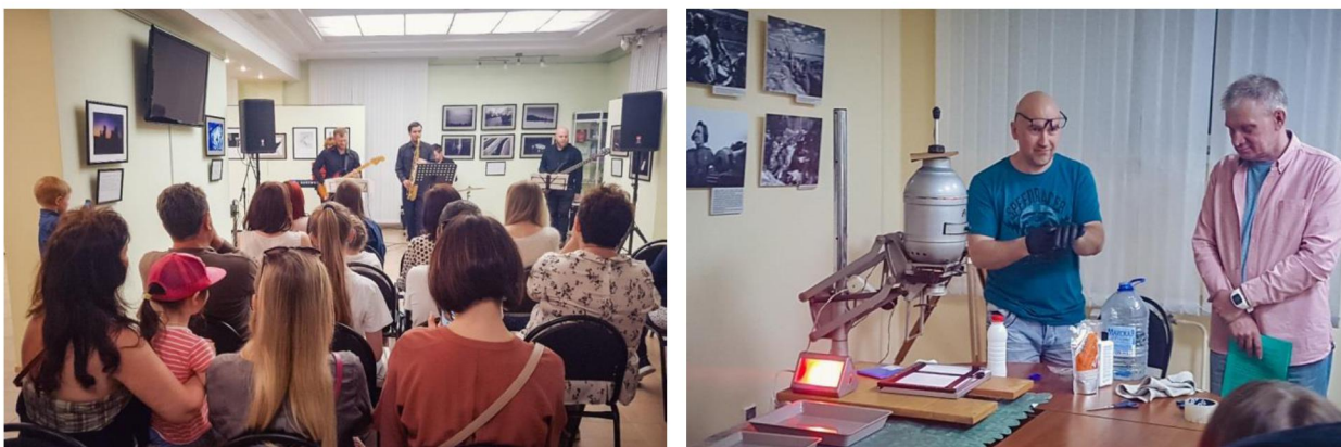
Всероссийская акция «Ночь музеев»

Культурно-образовательная деятельность фотогалереи в 2019 году ориентирована на презентацию и популяризацию культурного наследия нашего региона с целью развития творческого потенциала посетителей и формирования их ценностных ориентиров. Традиционными формами культурно-образовательной работы в музее являлись: экскурсия, музейный урок, тематический вечер, консультация. Также в отчетный период активно развивались новые для учреждения формы работы: творческие вечера, встречи в фотоклубе, интерактивные познавательные и игровые программы, мастер-классы и т.д.