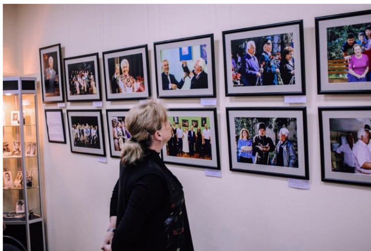
Фотовыставка «Эпоха мастера»