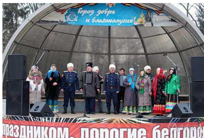
Праздничный концерт, посвященный Дню Защитника Отечества в парке Победы

К 74-й годовщине Победы в Великой Отечественной войне в учреждениях и на открытых площадках города прошли концертные мероприятия.