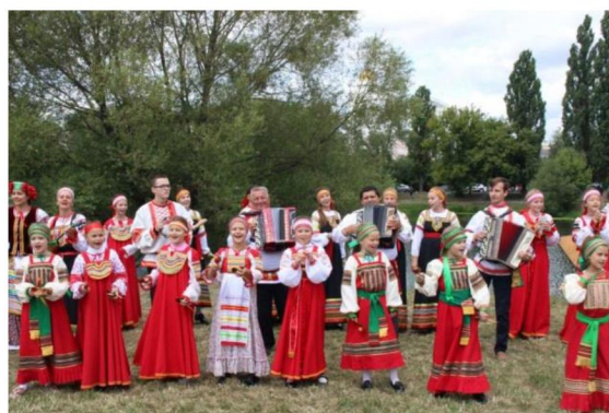
Праздничные мероприятия, посвященные Дню города