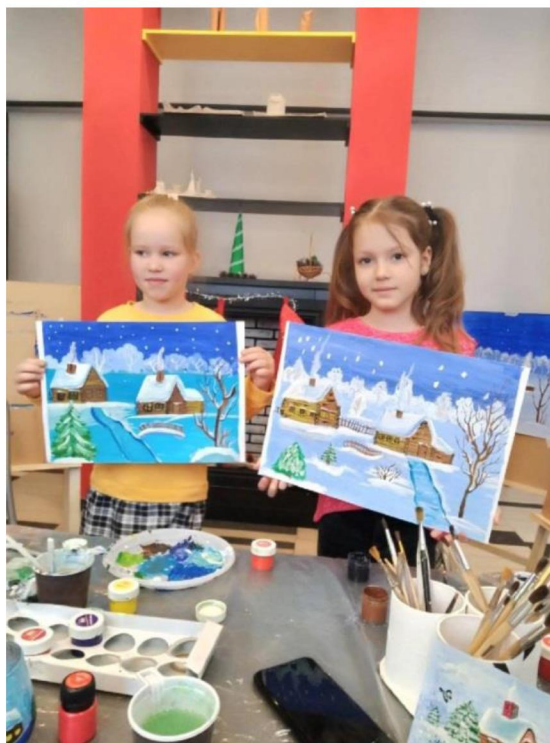
Мастер-класс в рамках абонемента «Юный художник»

экскурсий, 674 общественно-значимых и культурно-образовательных мероприятия, таких как мастер-классы, вечера искусств, творческие встречи, лекции, музейные уроки, познавательно-игровые программы. Число посетителей учреждения в отчетный период – 29346 человек.