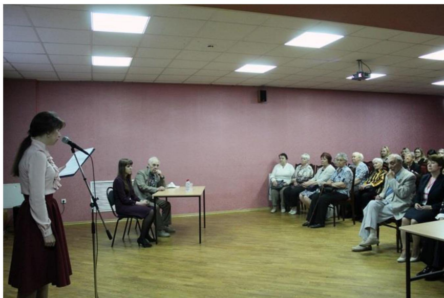
Встречи с писателями в муниципальных библиотеках города

Ко Дню России в муниципальных библиотеках состоялся цикл культурно-досуговых мероприятий «Мой гимн, мой флаг, моя Россия», в ходе которых пользователи расширили свои знания по истории России. Всего состоялось 28 мероприятий, которые посетили 1057 человек.