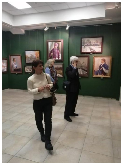
Цикл выставок «Художники Белогорья – родному краю»