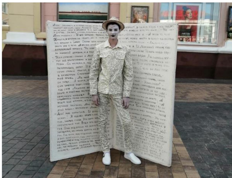
Фестиваль уличных театральных искусств «Белая маска»

4 августа у кинотеатра «Победа» и на «Белгородском арбате», на площадке торгового центра «Лента», фонтана «Непобедимый» в парке «Победы», а также на Свято-Троицком бульваре прошли показательные выступления ведущих хореографических коллективов города, танцевальные флешмобы и мастер-классы. В рамках этого дня были представлены танцы разных эпох, стилей и направлений от классики до современности.